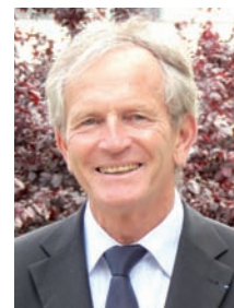
PRÉSIDENT Jean-Marie BRÉTILLON maire de Charenton-le-Pont